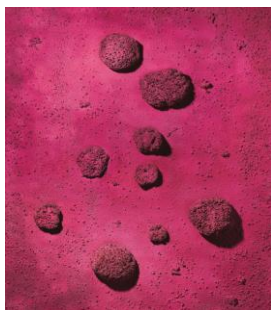
Yves Klein (France, 1928-1962), Le Rose du Bleu, (RE 22),

Les couleurs principales du spectacle : camaïeu de rouges, roses. Les couleurs qui apparaissent plus ponctuellement (bleus, jaunes, violets, etc) Peinture (créer des couleurs, remplir des espaces) Créer collectivement de nombreux roses différents en utilisant le rouge et le blanc (on peut ajouter une touche de bleu dans certains pour tendre vers le rose violacé) Sur un support préalablement délimité en zones aléatoires, remplir chaque espace de ces roses. Regarder les effets produits, commenter retoucher éventuellement avec du blanc pour valider des sens émis par les élèves.