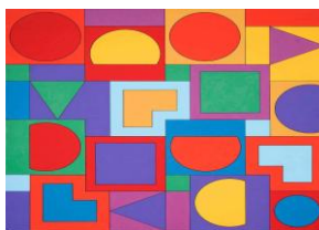
Victor Vasarely, 1906-1997, MC-BC, 1968,

Activité 1 Sérier des formes géométriques de différentes tailles dans la classe (carrés, ronds, triangles...) Isoler trois tailles de chaque formes . Sur un support, faire reporter en traçant leur contour un maximum de ces formes géométriques (une forme par support) Colorer l'intérieur de chaque forme en rose clair (activité 1), et l'extérieur en rose foncé. Puis demander de positionner la même forme de taille moyenne dans chaque figure colorée, puis la colorer de couleur foncée. Recommencer l'activité avec la figure de taille minimale On aura donc un assemblage de figures géométriques où pourront s'observer des emboitements (matriochkas) dans une composition de figures géométriques roses (ou d'un autre camaïeu de couleurs). Repasser les contours de ces emboitements au feutre rouge (composition rose) La même activité peut s'envisager sous forme d'empreintes